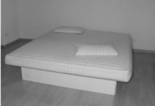
Fertiges Gelbett auf Podest